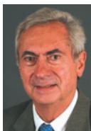
Pr Jacques Beaune, cardiologue.

Le stress aigu provoque une augmentation des besoins de sang au niveau du cœur, alors qu'il y a dans le même temps une diminution des apports et un risque de formation de caillots... Ces phénomènes provoquent un défaut de perfusion cardiaque, qui peut conduire à l'infarctus et à l'arrêt cardiaque (mort subite). »